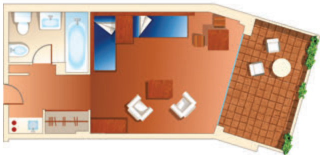
Eenkamerappartement (studio) voor 2 personen. 33,4 m 2